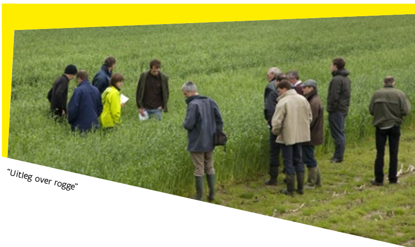
"Uitleg over rogge"

Het is niet evident om op de hoogte te zijn van al de nieuwste technieken of innovaties in de landbouw of tuinbouw. Bovendien is het best dat deze nieuwste technieken of innovaties worden getoond buiten het leslokaal en dus op het veld of in een bedrijf. Vanuit deze redenering werden binnen het derde Vlaams Programma voor Plattelandsontwikkeling subsidies vrijgemaakt voor demonstratieprojecten in de land- en tuinbouw.