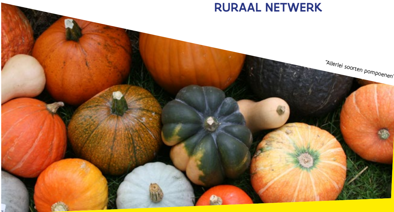
"Allerlei soorten pompoenen"