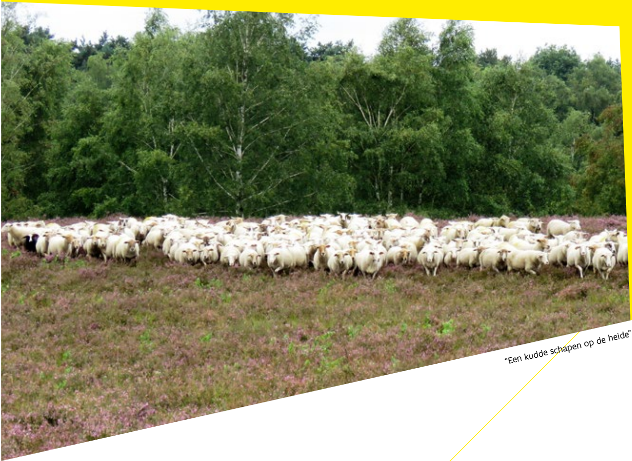
"Een kudde schapen op de heide"