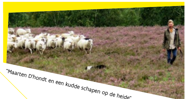
"Maarten D'hondt en een kudde schapen op de heide"

Wanneer we polsen naar de inkomsten, blijkt dat de begrazingscontracten het meeste geld in het laatje brengen. "10% van onze opbrengsten halen we uit de verkoop van lamsvlees, 90% uit de begrazingscontracten. Eigenlijk verhuren wij schapen per dag, met herder. Het loon van de herder wordt betaald door de klant, de schapen betalen zichzelf terug door de verkoop van het lamsvlees."