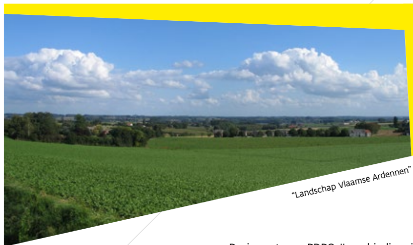
“Landschap Vlaamse Ardennen”

Verschillende maatregelen, waaronder de steun voor diversificatie-investeringen en de steun voor structurele investeringen, hadden ook een positief bedrijfseconomisch effect. Van vestigingssteun voor jonge landbouwers kon geen impact op de bedrijfseconomische kengetallen worden vastgesteld. Indirect had PDPO II ook een positief effect op de economie: tewerkstelling werd behouden en ook in aanverwante sectoren zoals de bouwsector en de machinebouw werd een toegevoegde waarde gecreëerd.