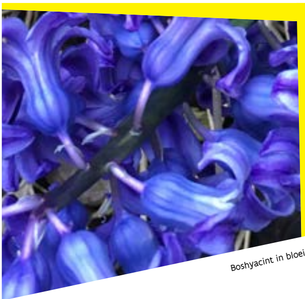
Boshyaacint in bloei