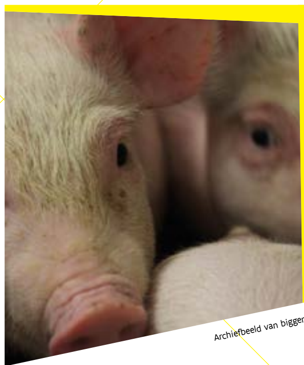
Archiefbeeld van biggen

Meer informatie over de steun voor de oprichting van producentenorganisaties vindt u op de website van het Departement Landbouw en Visserij.