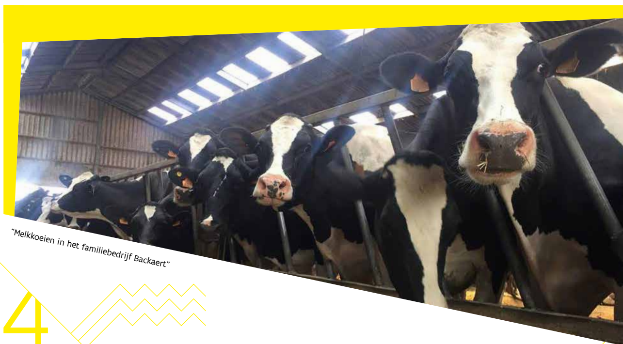
"Melkkoeien in het familiebedrijf Backaert"