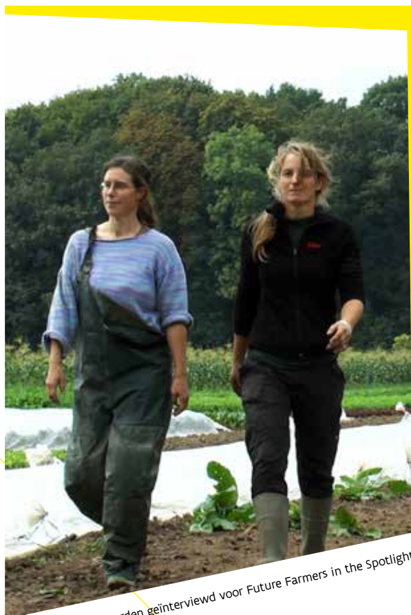
"Jonge landbouwers die werden geïnterviewd voor Future Farmers in the Spotlight"

Binnen dit initiatief nam het grootste deel van de toekomstige landbouwers innovatieve concepten over om hun producten aan de man te brengen, zich te verdiepen in nichemarkten, aan verbreding te doen, op innovatieve manieren grond aan te kopen ... De filmpjes geven een kijk op de verschillende mogelijkheden om aan landbouw te kunnen doen en inspireren de volgende generatie met positieve verhalen en landbouwmodellen die klaar zijn voor de toekomst. Je kan ze bekijken op https://future-farmers.net .