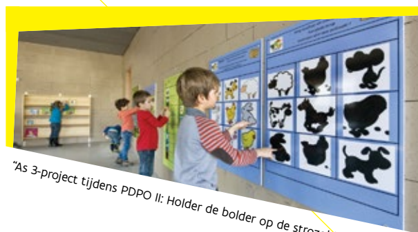
"As 3-project tijdens PDPO II: Holder de bolder op de strozolder"

Iedere provincie kan in zijn provinciaal plattelandsbeleidsplan echter de begunstigden beperken.