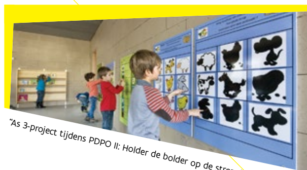
"As 3-project tijdens PDPO II: Holder de bolder op de strozolder"

Iedere provincie kan in zijn provinciaal plattelandsbeleidsplan echter de begunstigden beperken.