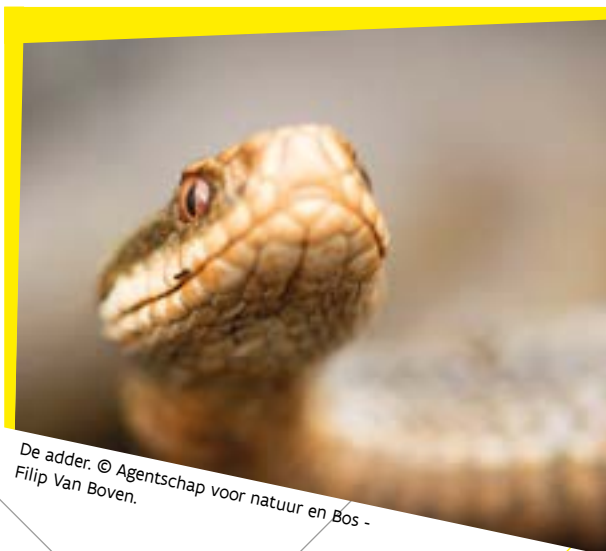
De adder.

"In de Visbeekvallei zelf komen momenteel opnieuw een klei-