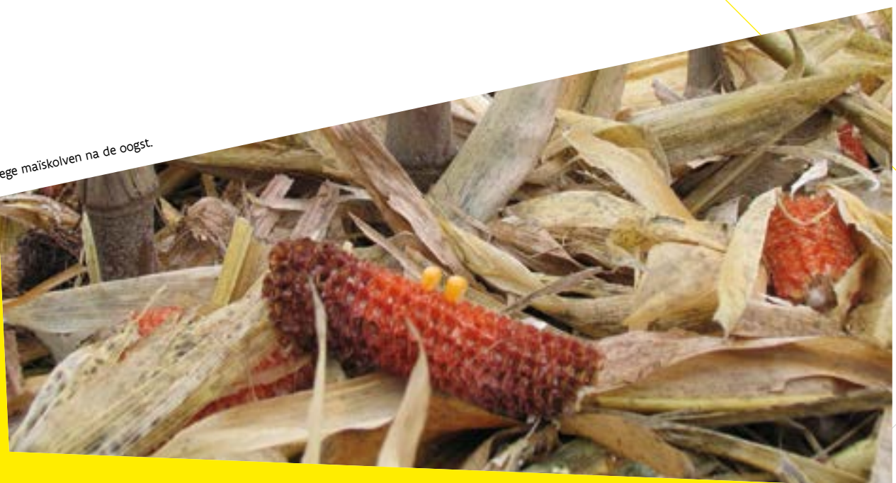
Lege maïskolven na de oogst.