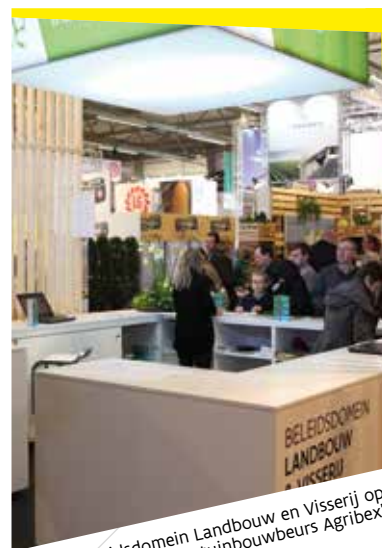
"Het beleidsdomein Landbouw en Visserij op land- en tuinbouwbeurs Agribex"

Een derde focus gaat over innovatieve teelten, waar de nadruk ligt op soja, quinoa en insectenkweek. We tonen een demo van sojaplanten en de bezoekers kunnen zich wagen aan insectenproevertjes.