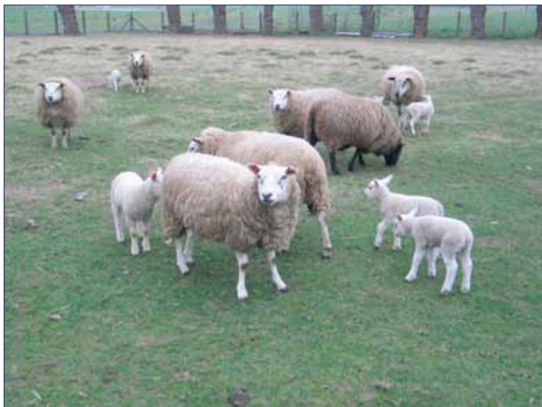
Schape en lammetjes in de weide

Een eerste grote studiedag, met name de consultatiedag 'Platteland na 2013: waar zetten we op in?', is zelfs al achter de rug. Op deze dag werden de verschillende plattelandsactoren samengebracht om met elkaar in debat te treden. Met deze studiedag werd de aftrap gegeven voor de voorbereiding van het toekomstige Programma voor Plattelandsontwikkeling. Dit nieuwe programma, het zogenaamde PDPO III, zal vanaf 2014 in werking treden. Gedurende 2012 en het volgende jaar zal hier heel wat werk rond verzet worden. Zo wordt een rapport uitgebracht met de resultaten van deze consultatiedag. Dit rapport zal wijd verspreid worden en zal ook via onze website te raadplegen zijn.