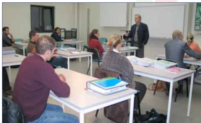
Cursisten opleiding in de land- en tuinbouw